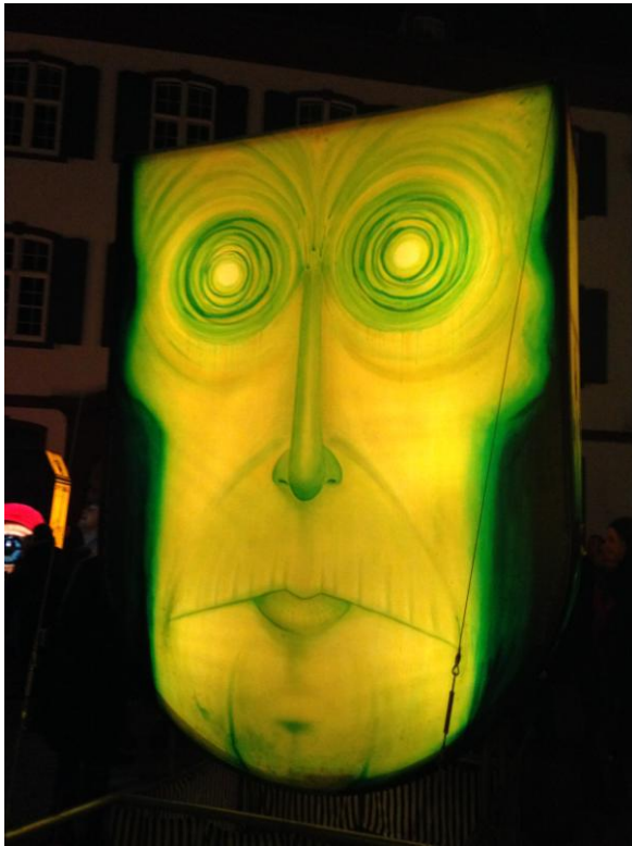
Laterne der Fasnachtsclique „Alti Richtig“ der Fasnacht 2014 Sujet: Ich ylyyd vor Nyyd